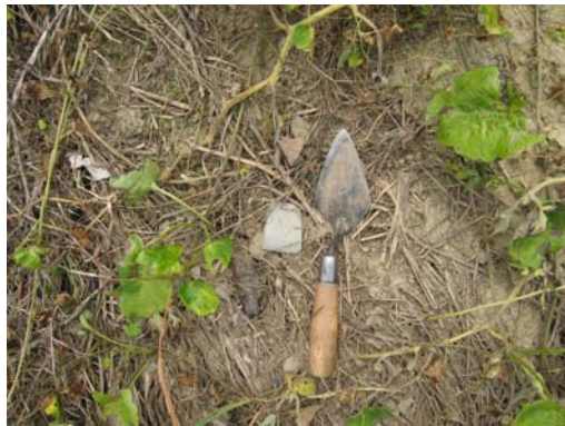
圖說：遺址西南側地表採集之石鏟