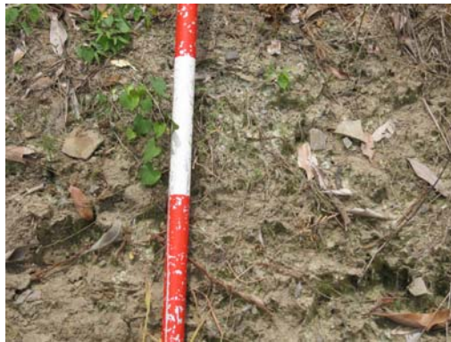
圖說：遺址西南側遺物出土照